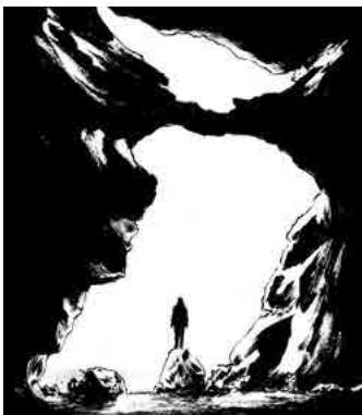
Fotografia: Héctor Márquez

les masses de negres i les llums amb tinta i pinzell. En aquestes pàgines, l'Héctor intenta transmetre les seves grans influències, provant tècniques noves i barrejant els seus gèneres preferits: els superherois i el gènere negre.