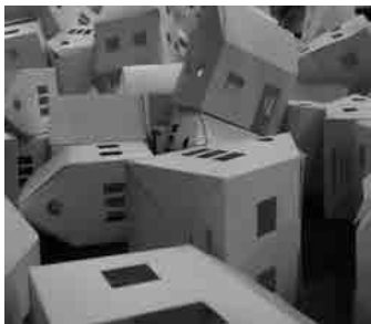
Fotografia: Lesley Telford