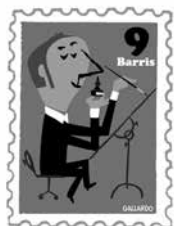
Fotografia: Miguel Gallardo