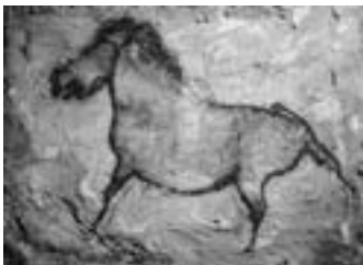
Fotografia: Enric Marimon

L'any 1975, l'Enric Marimon va visitar les Coves d'Altamira i en aquest viatge va començar el seu interès per l'art paleolític. Realitzant el treball que aquí exposa, vol inspirar-se i arribar a entendre la forma de vida d'aquell temps. En aquesta exposició podem gaudir de diverses reproduccions de pintures paleolítiques. Durant la inauguració, l'artista explicarà què és l'art rupestre i com ha realitzat les obres.