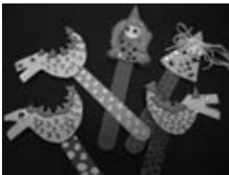
Fotografia: Amàlia Rivero

Sabem que encara queda un mes, però quan s'apropa el 23 d'abril, tot s'omple de roses i llibres. Quina millor manera per preparar-se per a aquesta data tan assenyalada en el nostre calendari que poder crear el teu punt de llibre de Sant Jordi. Un treball manual que ben segur acompanyarà els infants molt de temps!