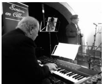
Fotografia: Can Verdaguer

Els nostres veterans Seniors en Allegro tornen a actuar a Can Verdaguer! Aquest cop la cita serà per celebrar les Festes del barri de Porta, amb el seu repertori de cançons tradicionals.